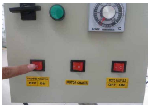
3 Encienda el botón de temperatura