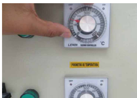
4 Ajuste el pirómetro superior a 140°C girando en el sentido del reloj