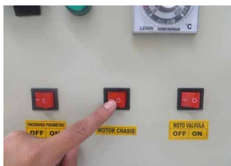
4 Espere 8 minutos y encienda el motor del chasis