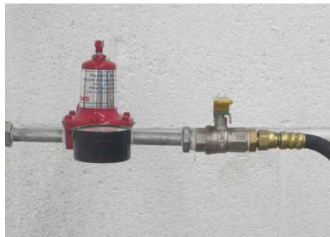
2 Use un regulador de gas de baja presión de 3/8"