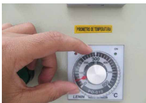
5 Ajuste el pirómetro superior a 50°C girando en el sentido del reloj