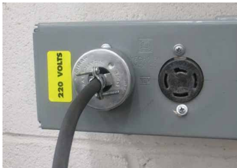
1 Conectar prensa a toma corriente

Antes de empezar a operar el equipo se recomienda tener preparada su harina de trigo en reposo.